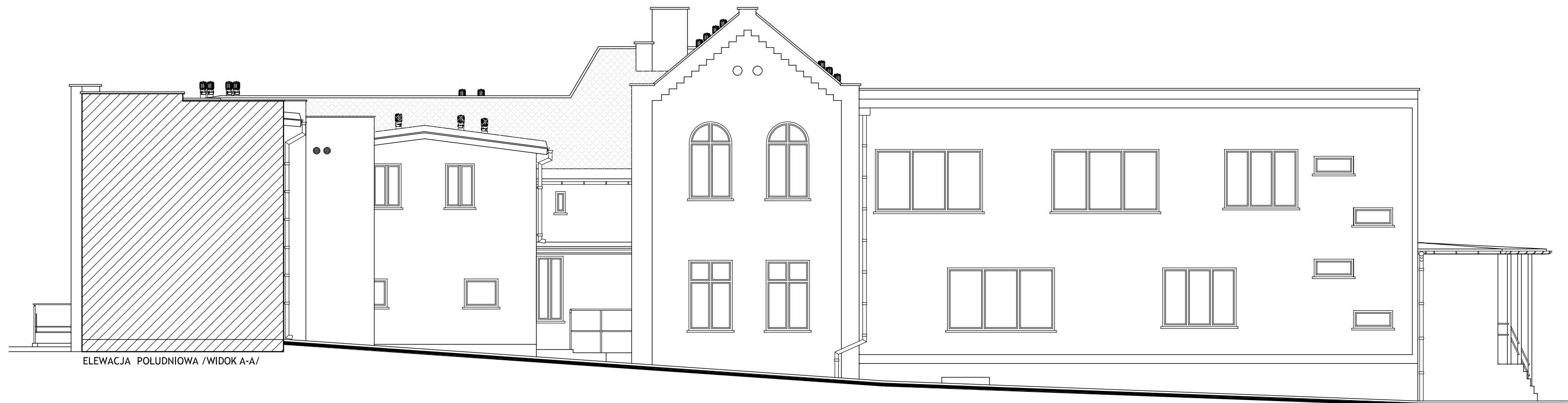
ELEWACJA POLUDNIOWA / WIDOK A-A/