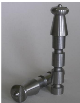
Rysunek 3 Przykładowe zdjęcie głowicy repera typu 87